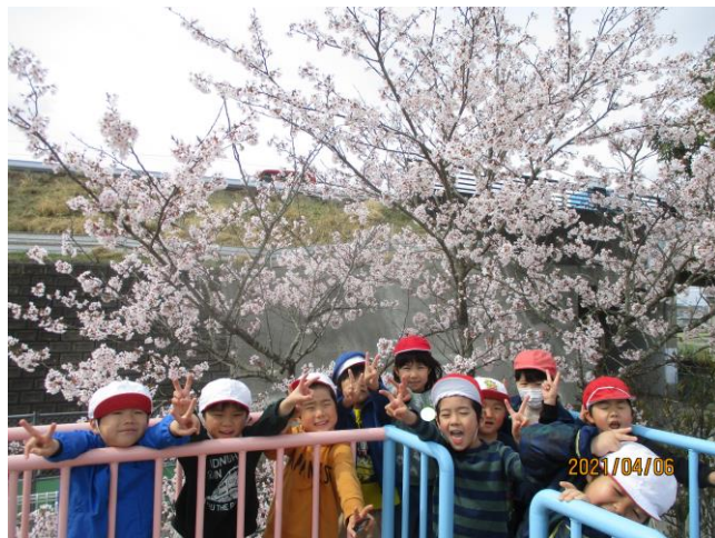
さくらの木の下で「はいっ！ポーズ👏🌸」